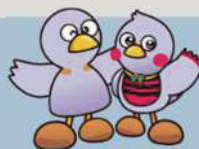
埼玉県マスコット